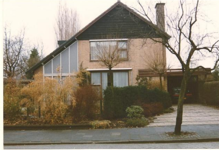
Emmapark 13 villa Den Teuling