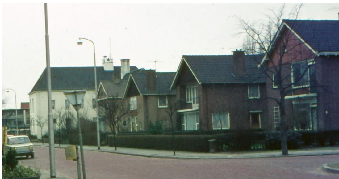
gemeentehuis 15 13 11 Emmastraat 2

Deze villa's zijn eind vorige eeuw gesloopt voor het nieuwe winkelcentrum.