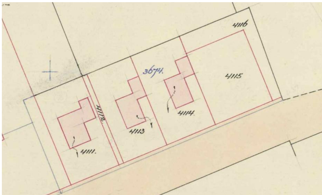
hulpkaart december 1957