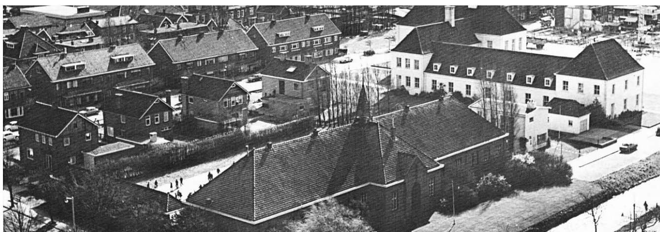
uit toren RK kerk jaar 1967