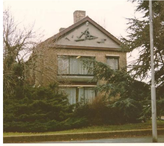
Emmapark 15 villa Sikkes,