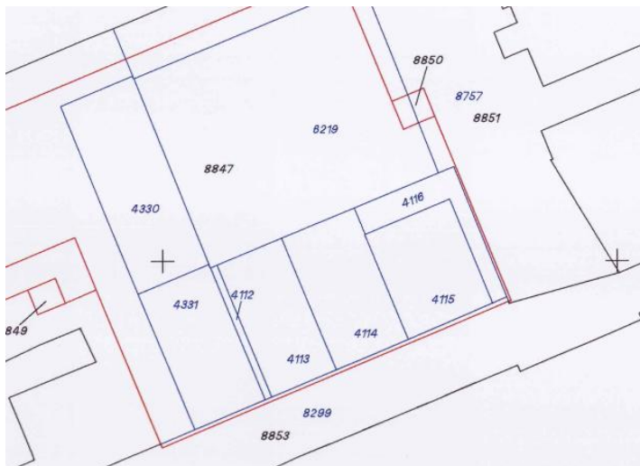
kadaster heden C8847