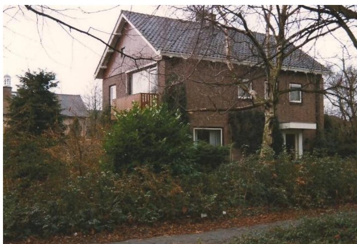
Emmastraat 2 villa Kerklaan