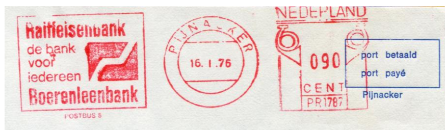
PR 1787 A3 R 0173-0176

De tekst was hetzelfde als de variant 3 van PR 1887 , maar hier met hun eigen postbusnummer, n.l. 5 . Daarvan zijn afdrukken bekend van januari 1973 t.e.m. januari 1976.