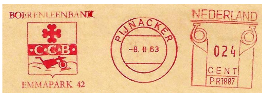
PR 1887 A1 R 1162-0263

Daar stond in het reclamestempel Boerenleenbank en het adres: Emmapark 42 . Daartussen stond het wapen van de Centrale Boerenleenbank te Eindhoven. Hiernaast een afdruk van dit frankeerstempel.